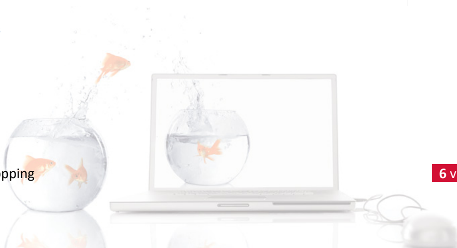
Figuur 8, Afleveradres