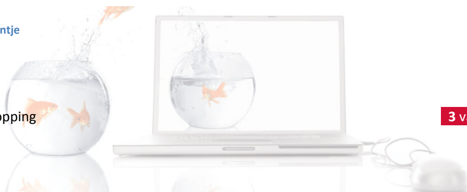
Figuur 3, Winkelwagentje