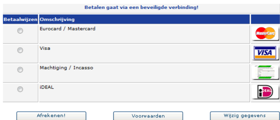
Figuur 9, Betaalpagina